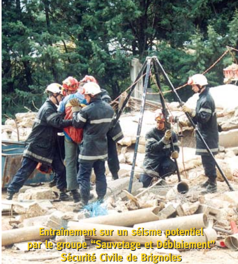
Entraînement sur un séisme potentiel par le groupe "Sauvetage et Déblaiement" Sécurité Civile de Brignoles