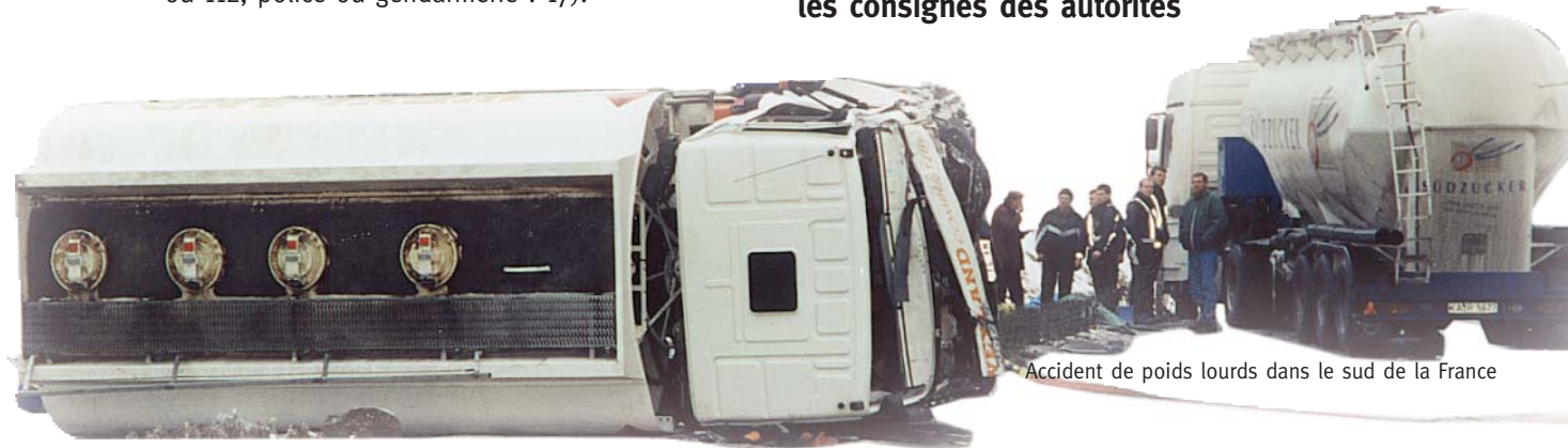
Accident de poids lourds dans le sud de la France

Dans tous les cas, respectez les consignes des autorités