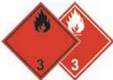
N°3 Danger de feu (matière liquide inflammable)