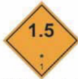
N°1.5 Sujet à l'explosion division 1.5