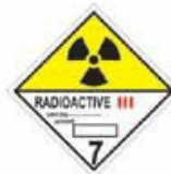
N°7C Matière radioactive dans des colis de catégorie III