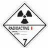
N°7A Matière radioactive dans des colis de catégorie I