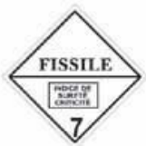
N°7E Matière fissile de la classe 7