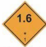
N°1.6 Sujet à l'explosion division 1.6