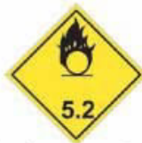
N°5.2 Peroxyde organique Danger d'incendie