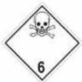
N°6.1 Matière toxique