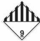
N°9 Matières et objets divers présentant, au cours du transport, un danger autre que ceux visés par les autres classes