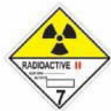
N°7B Matière radioactive dans des colis de catégorie II