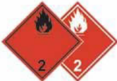
N°2.1 Gaz inflammable et non toxique