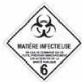
N°6.2 Matière infectieuse