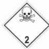
N°2.3 Gaz toxique