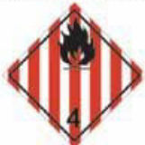
N°4.1 Danger de feu (matière solide inflammable)