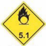
N°5.1 Matière comburante