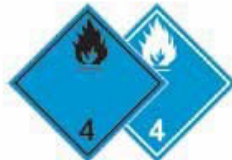
N°4.3 Danger d'émanation de gaz inflammable au contact de l'eau