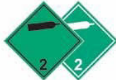
N°2.2 Gaz non inflammable et non toxique