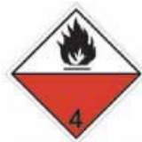
N°4.2 Matière sujette à inflammation spontanée