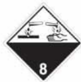
N°8 Matière corrosive