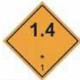
N°1.4 Sujet à l'explosion division 1.4