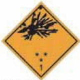
N°1 Sujet à l'explosion divisions 1.1, 1.2, 1.3