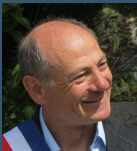
Le maire de Sainte-Croix-de-Quintillargues

En de telles circonstances, vigilance et entraide sont nécessaires et salvatrices.