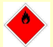
Symbole de danger