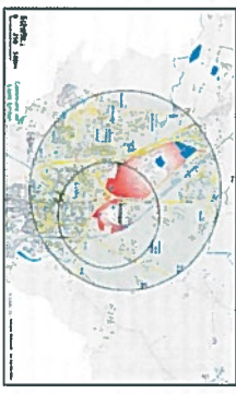
Carte du périmètre du PPI

Un plan de secours, le Plan particulier d'intervention (PPI) a été élaboré par le Préfet et est régulièrement mis à jour et testé. En matière d'urbanisme, un Plan de prévention des risques technologiques (PPRT) a été prescrit. Ce document a pour vocation de matérialiser l'urbanisation autour des sites et sera amené au plus tôt à être actualisé. Une plaquette d'information de la population est distribuée auprès de ces deux établissements et est distribuée aux habitants concernés.