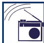
Ecoutez la radio pour connaître les consignes à suivre