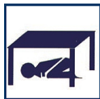
Abritez-vous sous un meuble solide