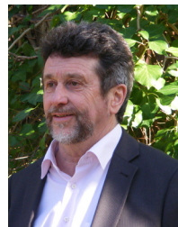
Jean-Luc DELPUECH, Maire

En vertu de la loi du 13 août 2004 et du décret 2005-1156 du 13 septembre 2005, le Document d'Information Communal des Risques Majeurs est un exercice «imposé» aux municipalités pour mieux assurer la sécurité et la sauvegarde de tous.