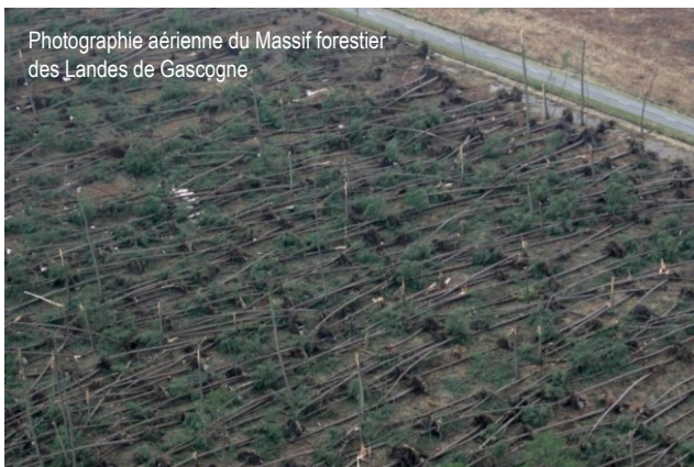
Photographie aérienne du Massif forestier des Landes de Gascogne

Météo France diffuse aux autorités et aux publics, des cartes de vigilance qui sont suivies par des bulletins d'informations complémentaires lors de vigilance orange ou rouge