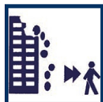
Eloignez-vous des bâtiments et des zones instables