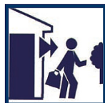
Evacuez le bâtiment