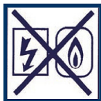
Coupez l'électricité et le gaz