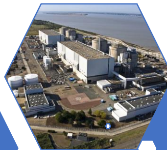
Centrale nucléaire de Blaye