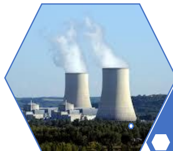
Centrale nucléaire de Golfech

Participation au plan de distribution des comprimés d'iode selon les consignes de la Préfecture de Lot et Garonne